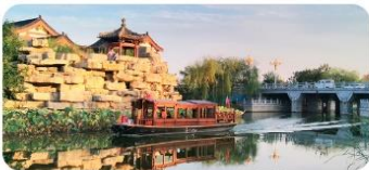
Phố cổ Khai Phong

✚ Xem biểu diễn "Shaolin Kungfu" tại Thiếu Lâm Tự