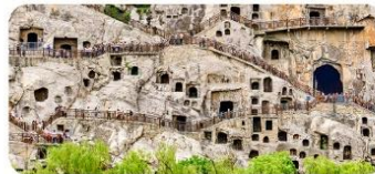
Hang đá Long Môn