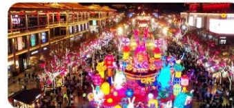
Tây An Đại Đường Bất Dạ Thành