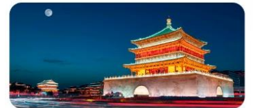
Quảng trường Tháp Chuông