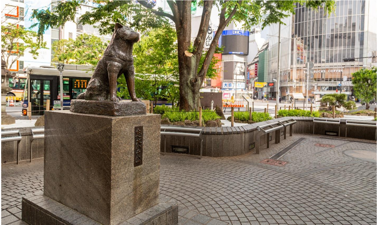
Bức tượng Hachiko nổi tiếng tại giao lộ Shibuya