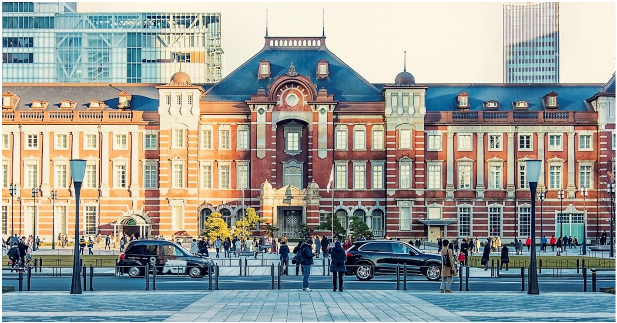
Quảng trường Tokyo