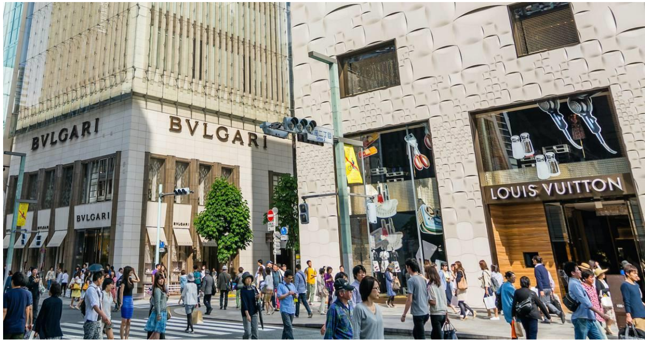
Ginza – khu phố "siêu sang trọng"