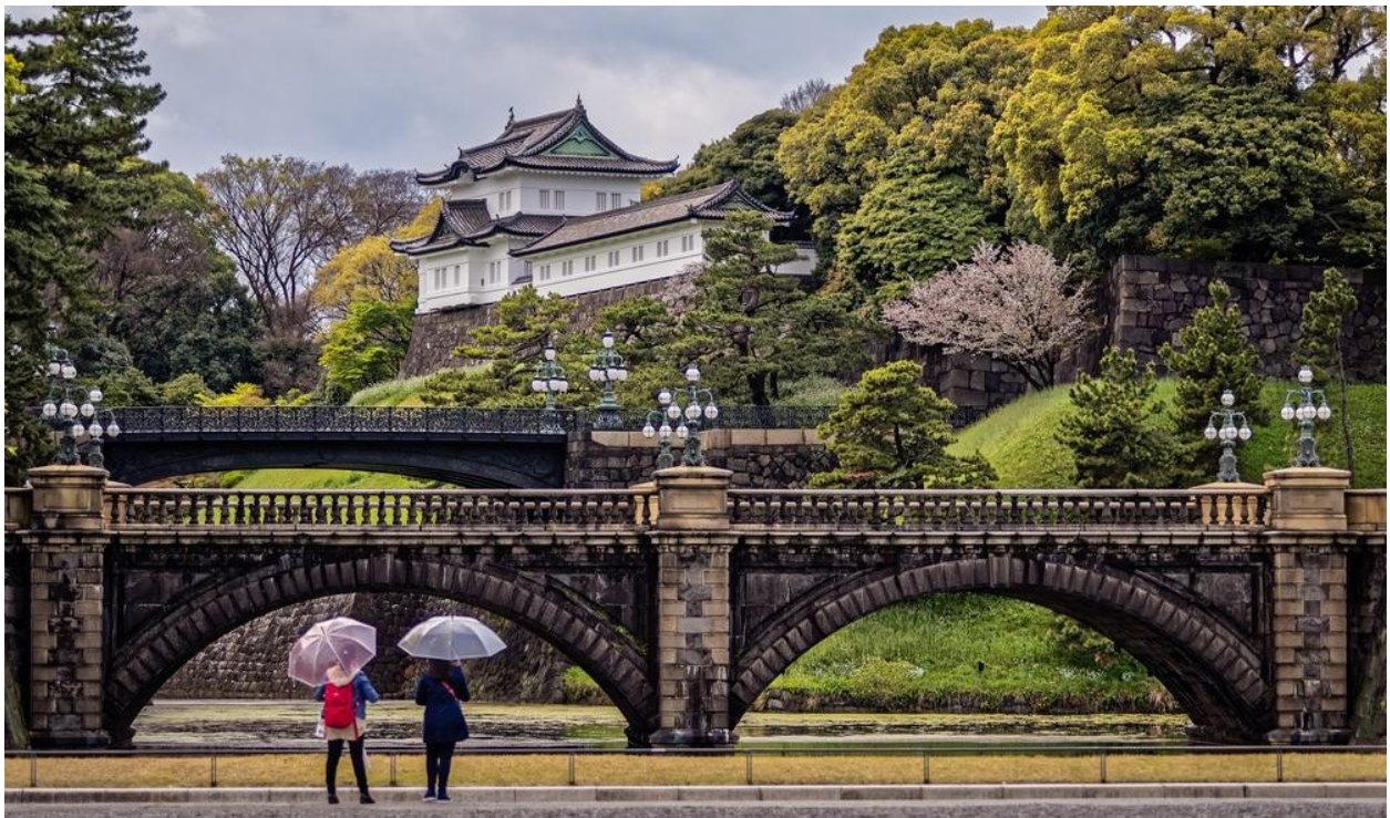
Hoàng cung Nhật Bản