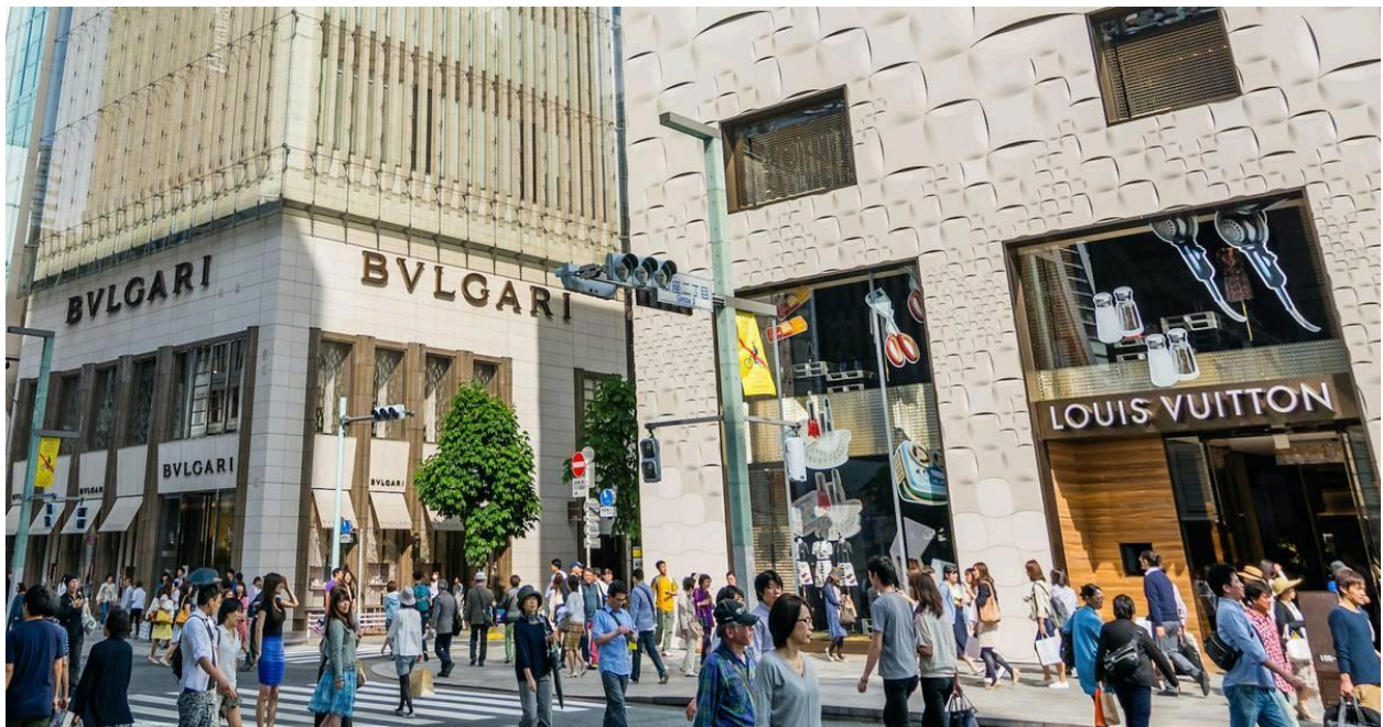
Ginza – khu phố "siêu sang trọng"