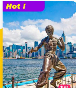
Khám phá Đại lộ Ngôi sao