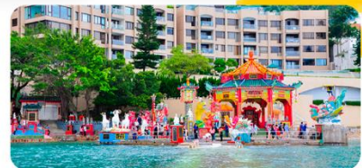
Vịnh nước cạn