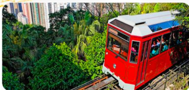
Đỉnh núi Thái Bình