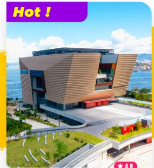
Chiêm ngưỡng Bảo tàng Cổ Cung