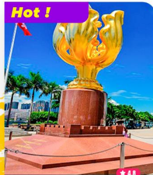
Tham quan Quảng Trường Dương Tử Kinh