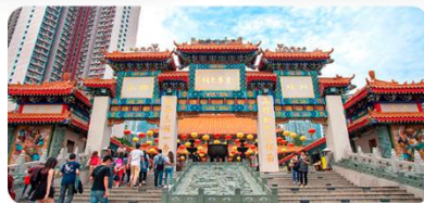
Miếu Huỳnh Đại Tiên