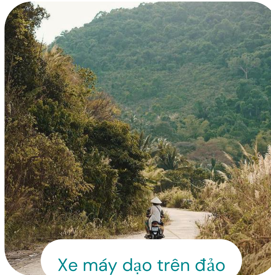
Xe máy dạo trên đảo