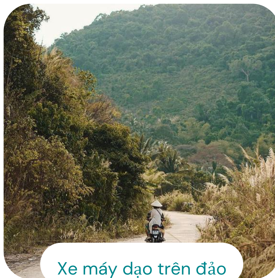
Xe máy dạo trên đảo

Lưu ý: Trên đảo di chuyển bằng phương tiện xe máy