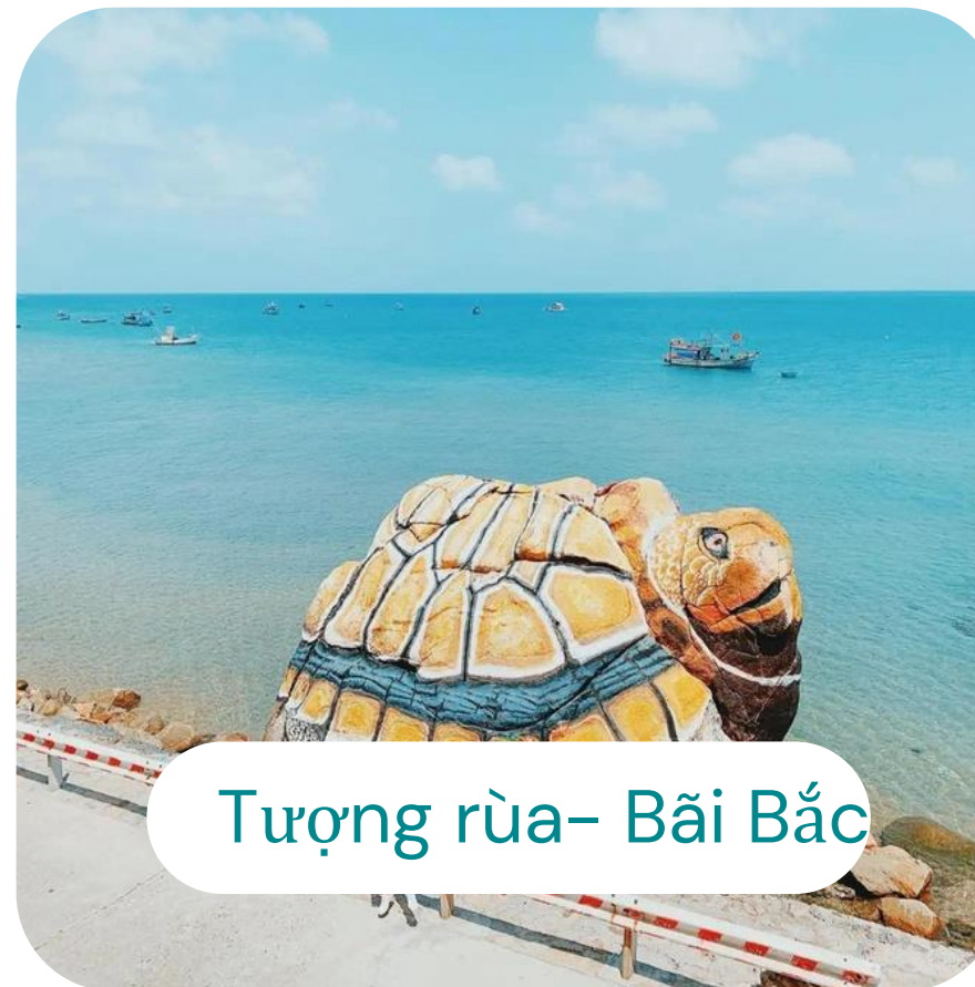
Tượng rùa- Bãi Bắc