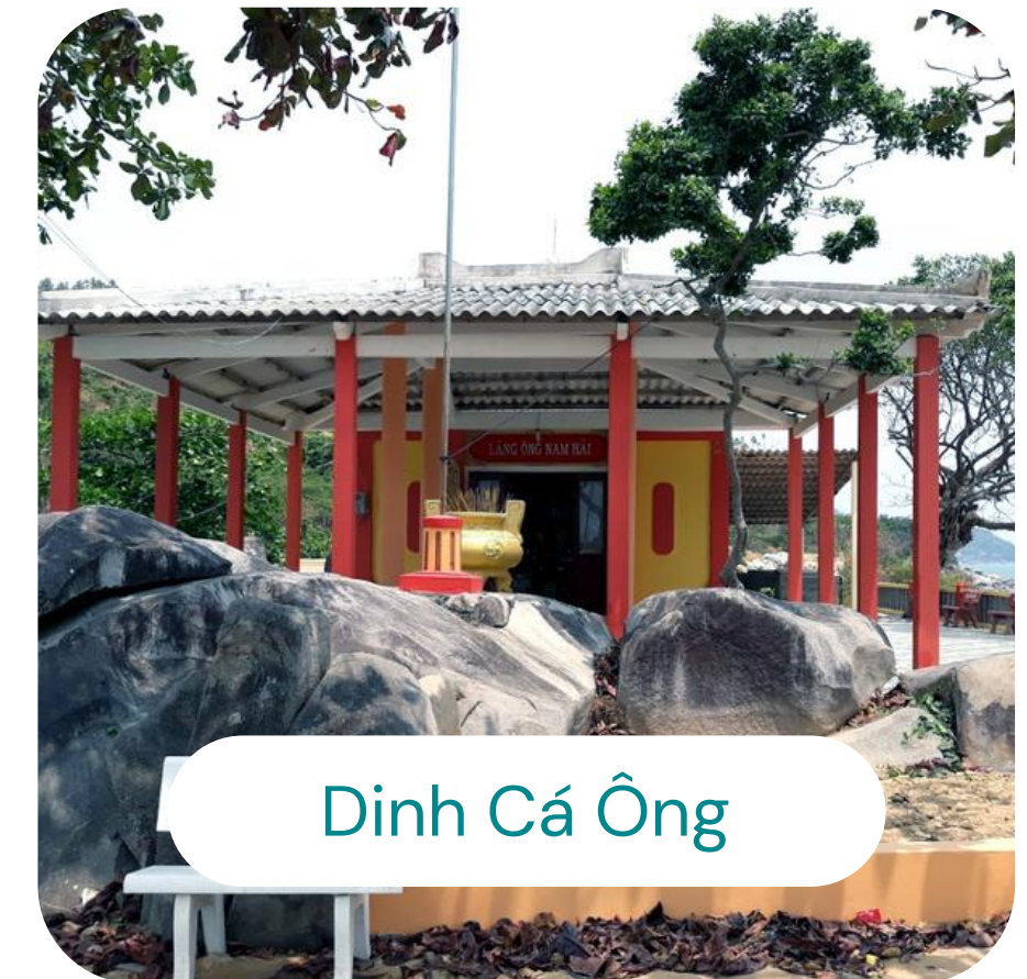
Dinh Cá Ông