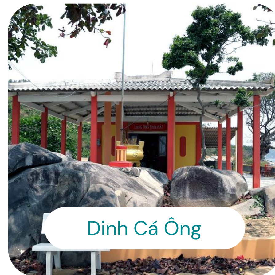
Dinh Cá Ông