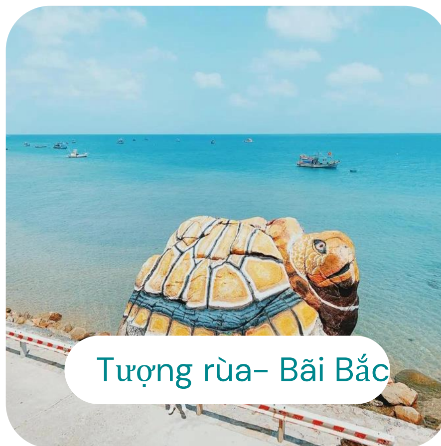
Tượng rùa- Bãi Bắc