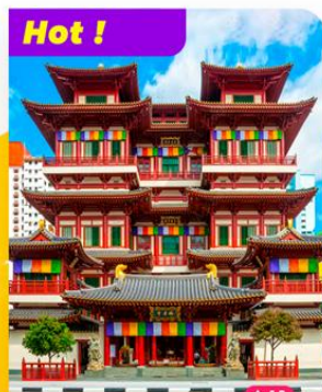
Hot ! Tham quan Chùa Răng Phật