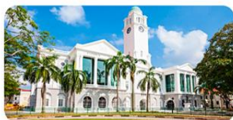
Nhà hát Victoria