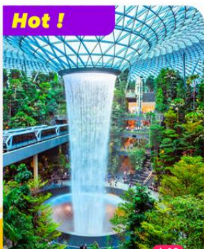
Hot ! Khám phá Jewel Changi