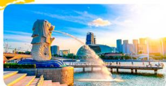
Công viên sư tử biển