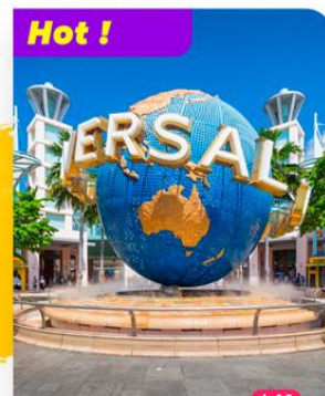
Hot ! Vui chơi tại Đảo Sentosa