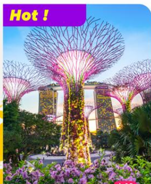
Hot ! Khám phá Gardens by the Bay