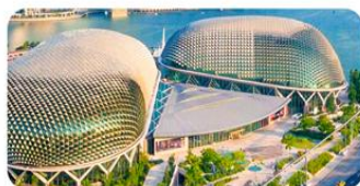
Nhà hát Esplanade