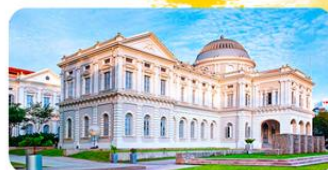
Tòa nhà Quốc Hội

➤ TẶNG VÉ TÀU ĐIỆN TRÊN KHÔNG ĐẾN VIVO CITY