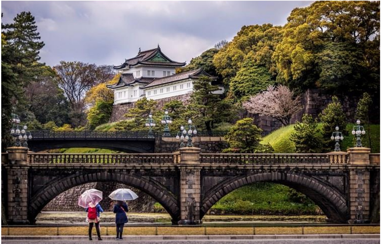
Hoàng cung Nhật Bản (chụp hình bên ngoài)