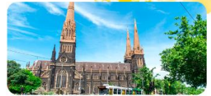
Nhà thờ Thánh Patrick