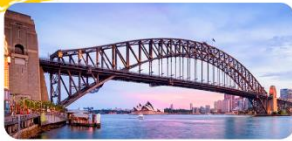
Sydney Harbour Bridge