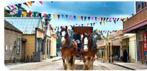
Thị trấn Ballarat