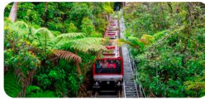
Tàu Kéo Sennic World